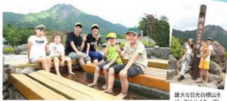
展望台を兼ねた眺望抜群の「天空の足湯」で、のんびりリラックス

山頂駅には、「日光白根山」が見渡せる天空カフェ、足湯、テラスなどが点在。涼風が吹き渡る山頂で高原の休日を満喫しましょう!