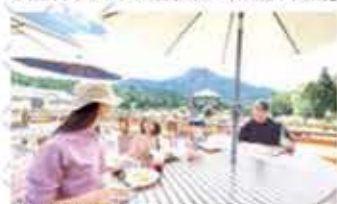
開放感あふれる天空カフェ